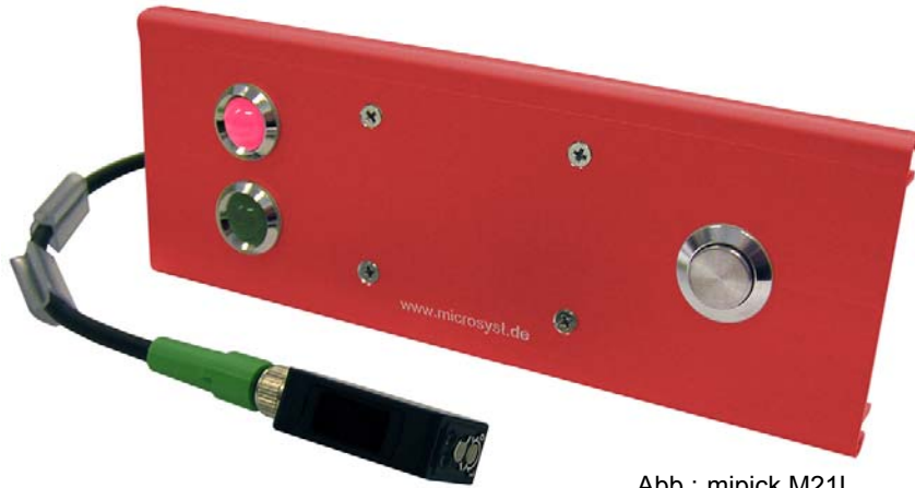
Abb.: mipick M21L